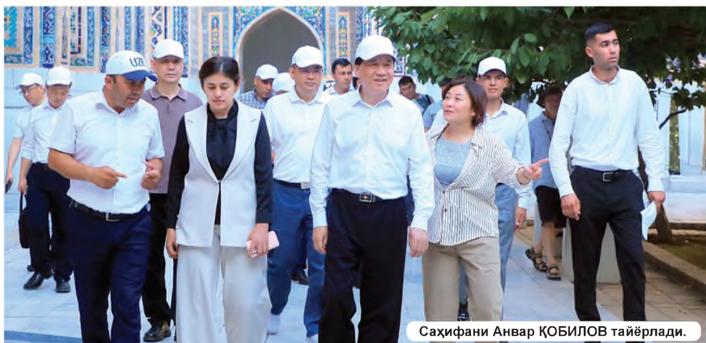
Саҳифани Анвар ҚОБИЛОВ тайёрлади.

“Халқ сўзи” газетаси (2024 йил 6 июль, 135-сон)