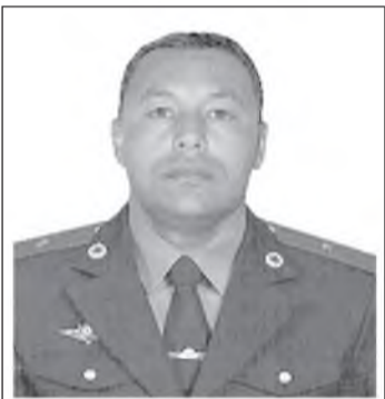
Аллаёров Очилди Ибрагимович – Ўзбекистон Республикаси Фавқулодда вазиятлар вазирлиги батальон командири