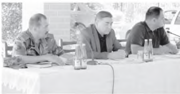
Тадбир давомида болажонларнинг дам олиш вақтини мазмунли

биячилари, спорт йуриқчилари, тиббиёт ходимлари, Касаба уюшма кўмиталари раислари, тармоқ Касаба уюшмалари Республика кенгашининг вилоятдаги масъул ташкилотчилари, меҳнат ва дам олиш оромгоҳлари раҳбарлари, Касаба уюшма фаоллари, оммавий ахборот воситалари ходимлари иштирок этдилар.