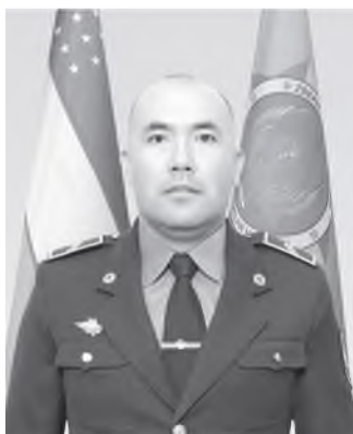
Исматов Фаррухжон Комилджонович Ўзбекистон Республикаси Фавқулодда вазиятлар вазирлиги Республика қутқарув маркази гуруҳ командири