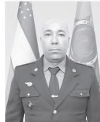
Насруллаев Иномжон Эркинович Ўзбекистон Республикаси Фавқулодда вазиятлар вазирлиги Республика қутқарув маркази хизмат бошлиғи