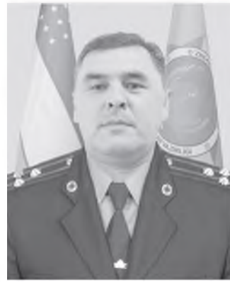
Сотиев Хуршид Тўлқинбоевич Ўзбекистон Республикаси Фавқулодда вазиятлар ва- зирлиги бош бошқармаси бошқарма бошлиғи