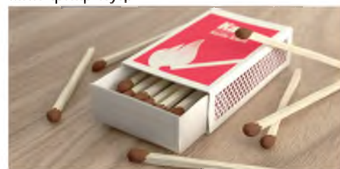
Мазкур саҳифа интернет манбалари асосида тайёрланди.

Бу кашфиёт бизга олов ёқиш масаласига бутунлай бошқа томондан ёндашиш имконини берди. Ўша вақтдан бери кўплаб мамлакатларда олимлар қулай ва хавфсиз гугуртларни яратиш бўйича тадқиқотларни бошладилар, лекин халқаро патент ҳуқуқи ҳали мавжуд эмас эди. Шу сабабли, бугунги кунда ҳам гугуртларнинг биринчи ихтироچиси ким бўлганлиги ҳақида умумий фикр йўқ.