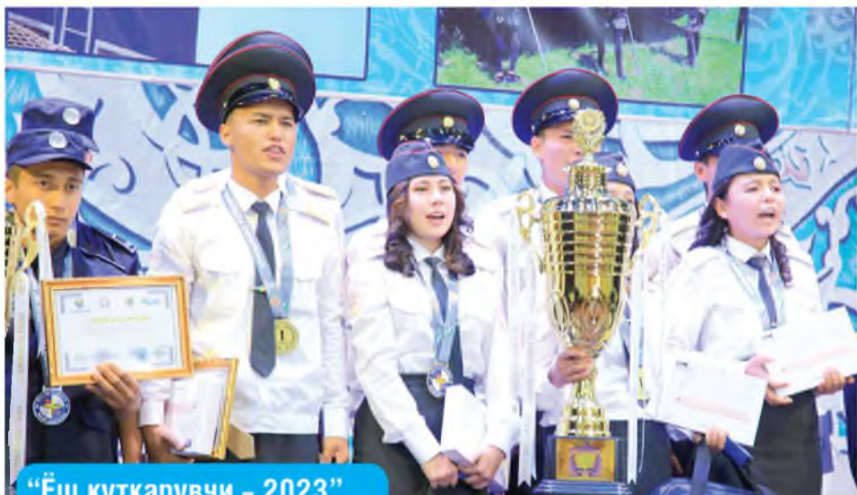
“Ёш қутқарувчи – 2023”